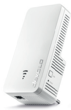
08960 (DE, AT, FR, BE, NL, ES, PT, CH, PL, EU)