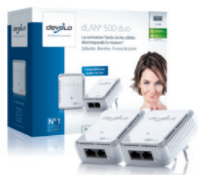
dLAN® 500 duo Starter Kit