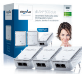
dLAN® 500 duo Network Kit