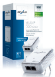
dLAN® 500 duo

2 connecteurs réseau Fast Ethernet – un appareil supplémentaire peut être connecté à tout moment au deuxième port Ethernet.